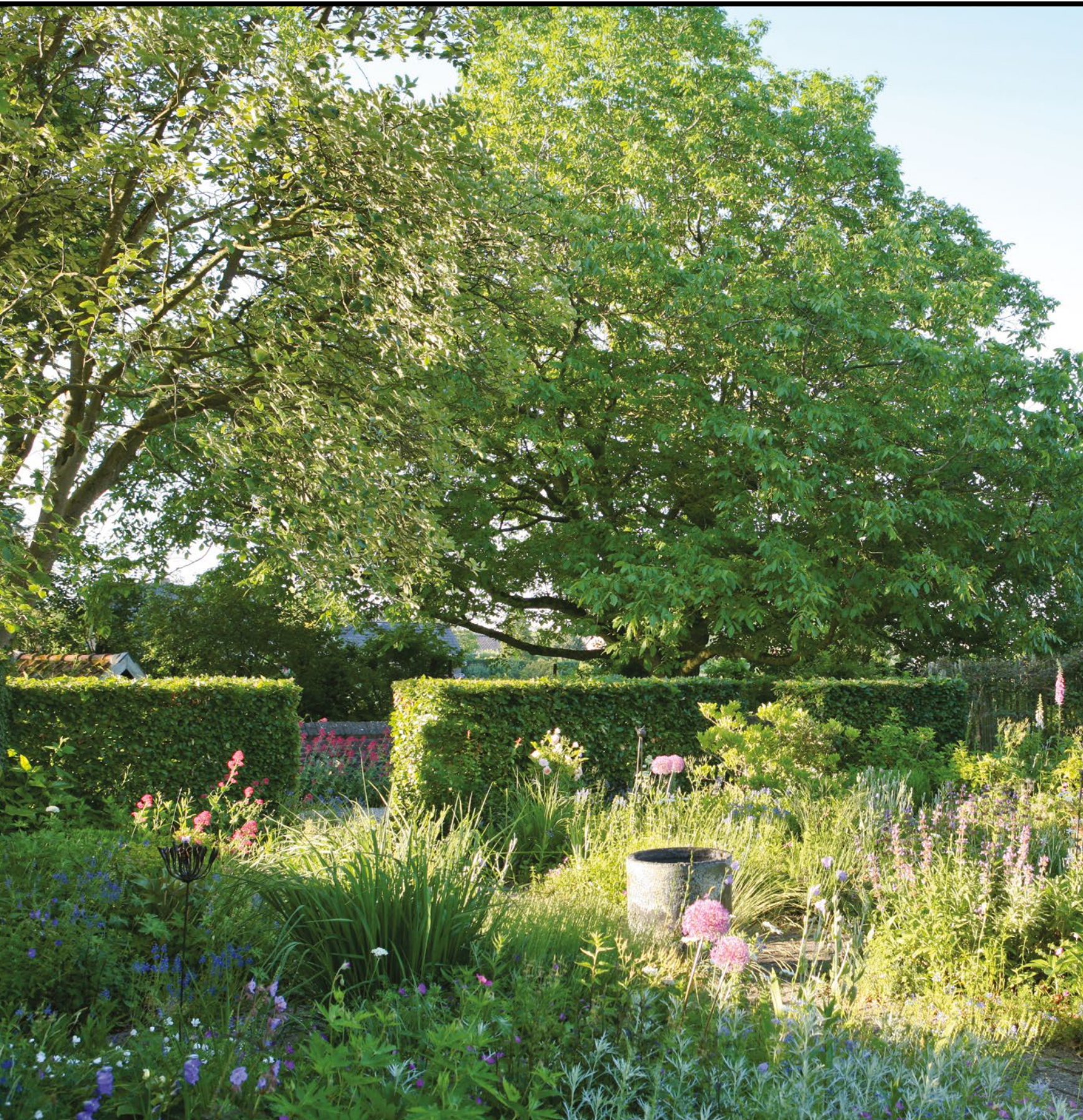
De voortuin van 'De Achtertuin'.

Een kijkje in de tuin bij mensen die niets liever doen dan beplantingsplannen maken, zaaien, schoffelen, oogsten, snoeien én genieten van al dat groen.